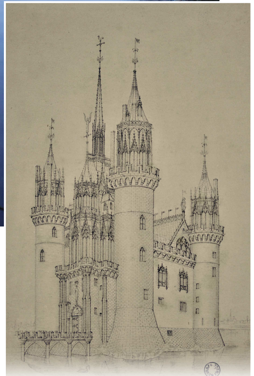
Le château de Mehun-sur-Yèvre